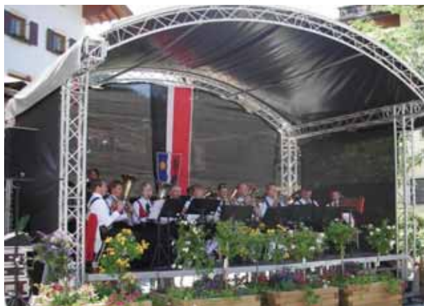
Konzert der Kleinen Partie beim „Ortsbusfest“ auf dem Rüfiplatz