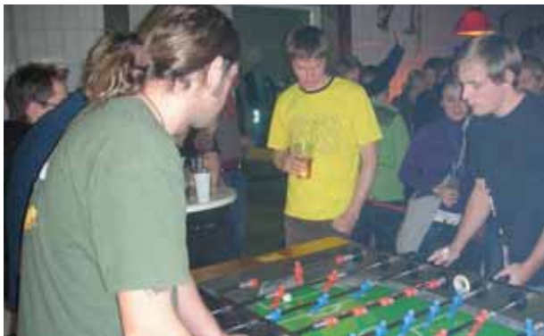
Das Tischfußballturnier war von harten und „taktischen“ Kämpfen geprägt.