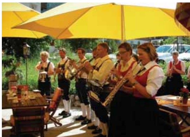
Ständchen im „Schatten“ beim Dorffest 2007