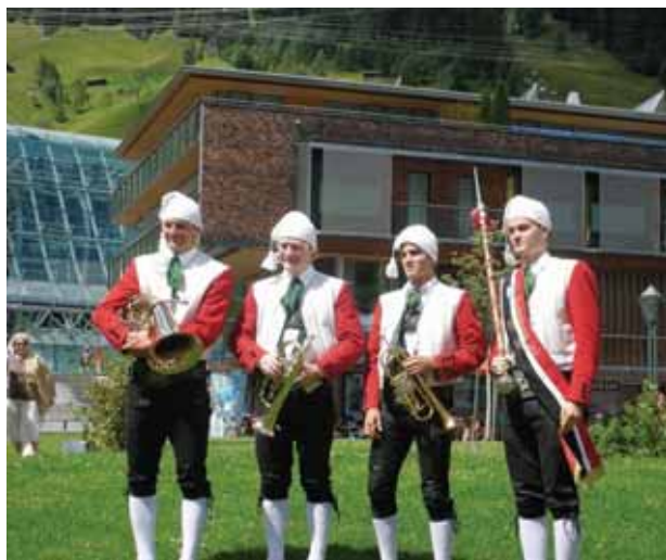
Vorbereitung auf den Umzug beim Arlberger Musikfest in St. Anton

Auch diesen Sommer „stellte die Trachtenkapelle Lech wieder ihren Mann/ihre Frau“ und nahm zahlreiche musikalische Termine wahr. Auf die schon traditionelle Saisonseröffnung in unserem Nachbarort Warth folgten bis in den Herbst viele weitere sehr gut besuchte Platz- und Abendkonzerte. Ebenfalls sehr aktiv waren unsere Ensembles, die „Lecher Alphornbläser“, die „Kleine Partie“ und die „Lecher Weisenbläser“.